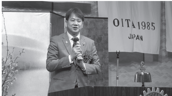
三村ガバナー挨拶